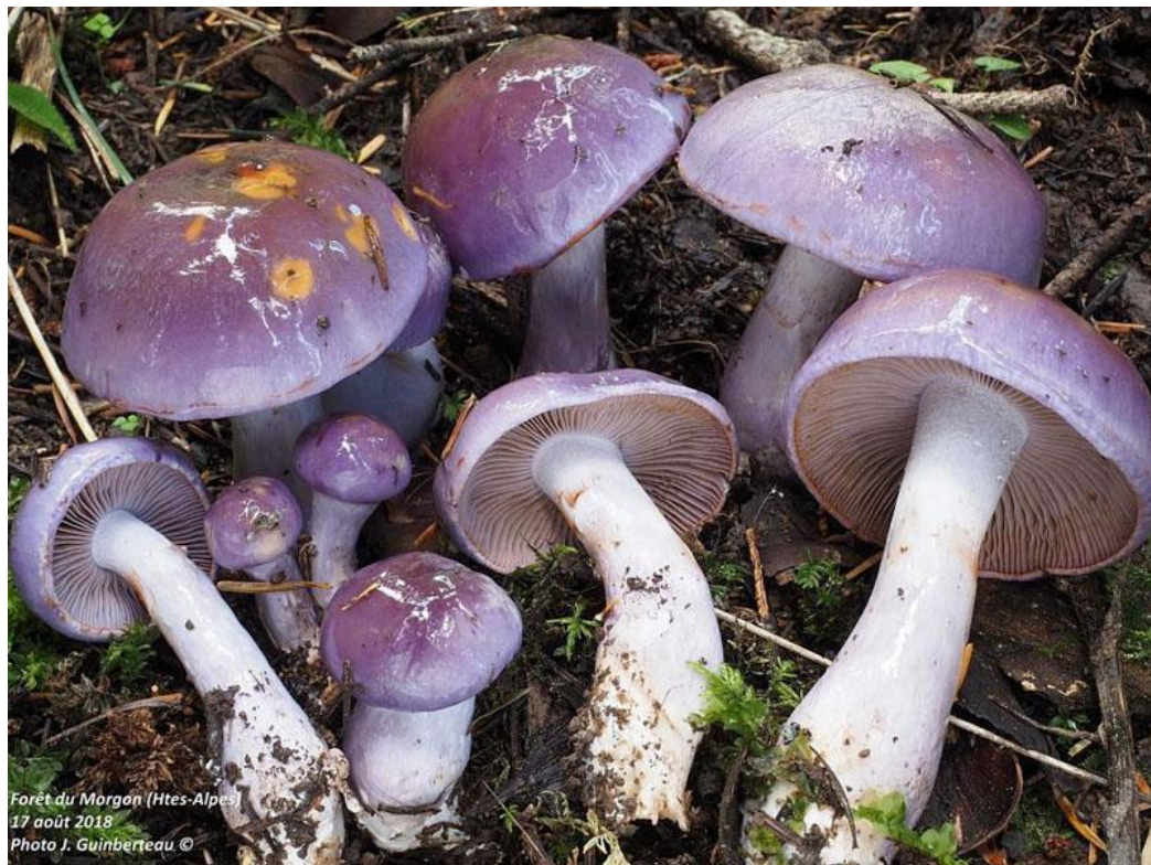
Forêt du Morgon (Htes-Alpes) 17 août 2018

Observations : Ce beau Myxaciace est facile à reconnaître sur le terrain à sa couleur d'un violet intense au début et à sa forte viscosité, au moins par temps humide. Le microscope permet de confirmer la détermination en mettant en évidence des spores subsphériques.