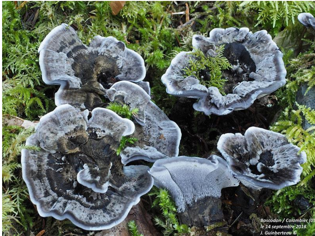
Boscodon / Colombier (05) le 14 septembre 2018